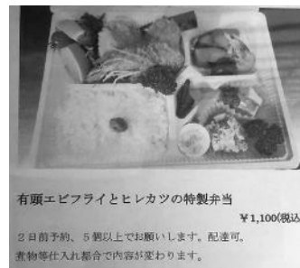
有頭エビフライとヒレカツの特製弁当 ¥1,100(税込) 2日前予約、5個以上でお願いします。配達可。 お物等仕入れ都合で内容が変わります。